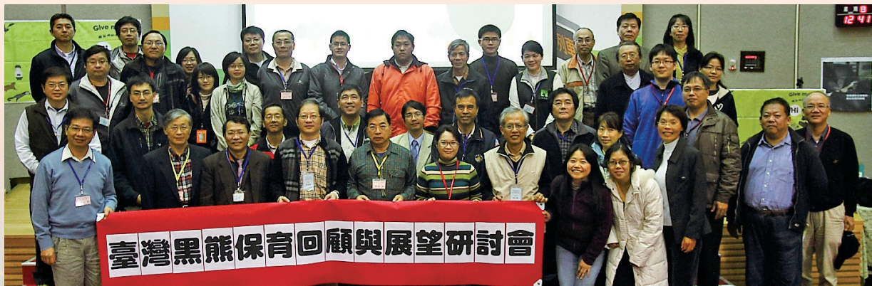
臺灣黑熊保育與展望研討會大合照