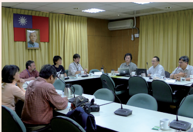
外國學者與核心工作小組會議