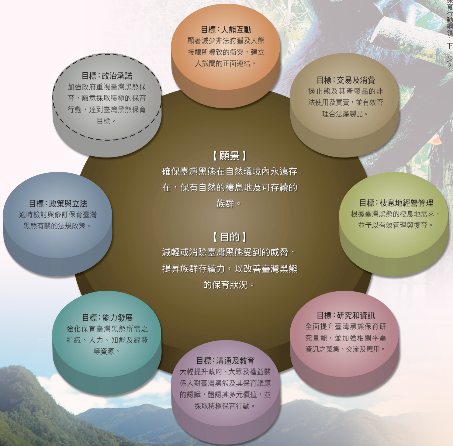
圖、臺灣黑熊保育行動綱領之綱要圖