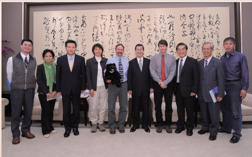
臺灣黑熊核心小組成員晉見前副總統蕭萬長並合照