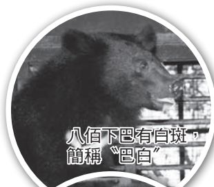
八百下巴有白斑，簡稱「巴白」